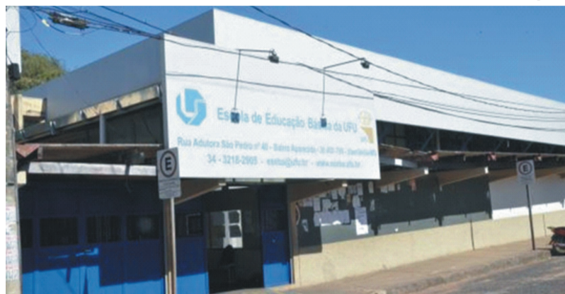
Escola de Educação Básica da UFU